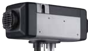
Air Top 2000 Luftheizgerät

Ob batteriebetrieben oder mit Direktantrieb: Mit einer automatischen Temperaturregelung stellen unsere Systeme sicher, dass sensible Waren selbst über große Distanzen sicher transportiert werden.